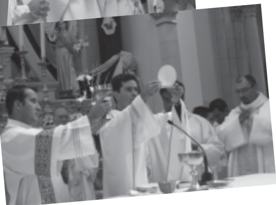
Momentos de la celebración en el Canta Misa