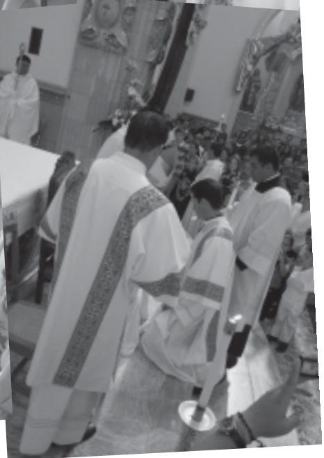
Momentos que se vivieron en la Ordenación