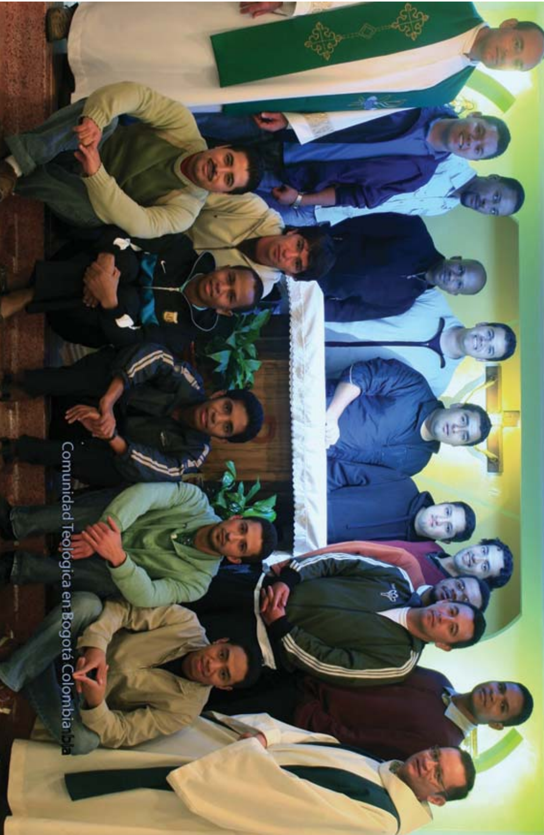
Comunidad Teológica en Bogotá Colombiana